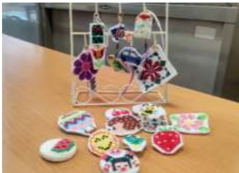
ストラップ・ボタン100円

刺繍ということで色鮮やかで可愛らしいデザインがたくさんあります。お部屋や玄関に飾ってもオシャレです♪ ストラップやボタンもあるのでワンポイントの装飾などにおすすめです。プラザ六中にお越しの際はぜひ、お立ち寄りください。 文：江口