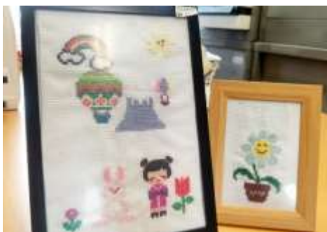
額入り・壁掛け300~500円

今回、手工芸部門よりクロスステッチで作った商品のご紹介です。 額に入ったスタンドタイプや壁掛けタイプの商品。ストラップとボタンのものが新しいラインナップとして販売いたします♪